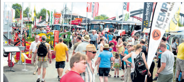
Von 29. Juni bis 2. Juli können Messesfans jeweils von 9 bis 18 Uhr zahlreiche Produkte und Angebote entdecken.